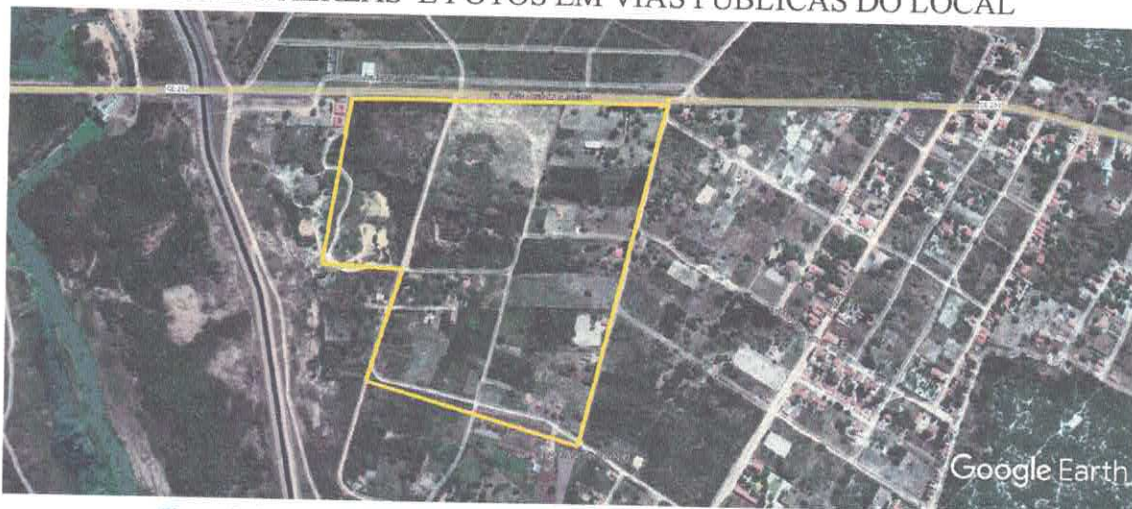
Figura 1 - Imagem aérea da área pertencente ao poder público destinada ao DIP-2