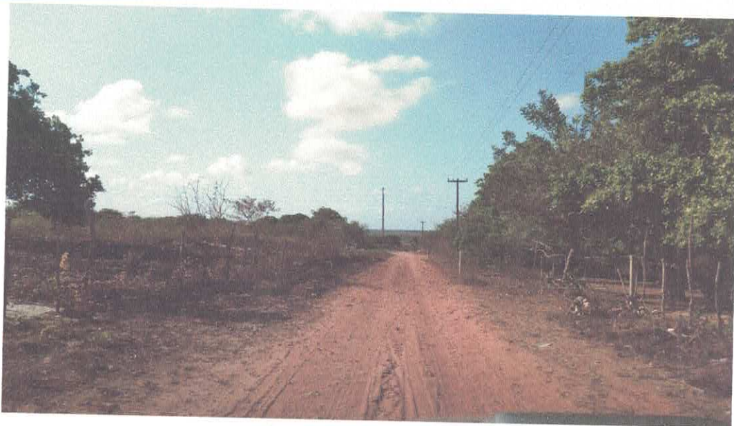
Figura 7 - vias interna do DIP-2