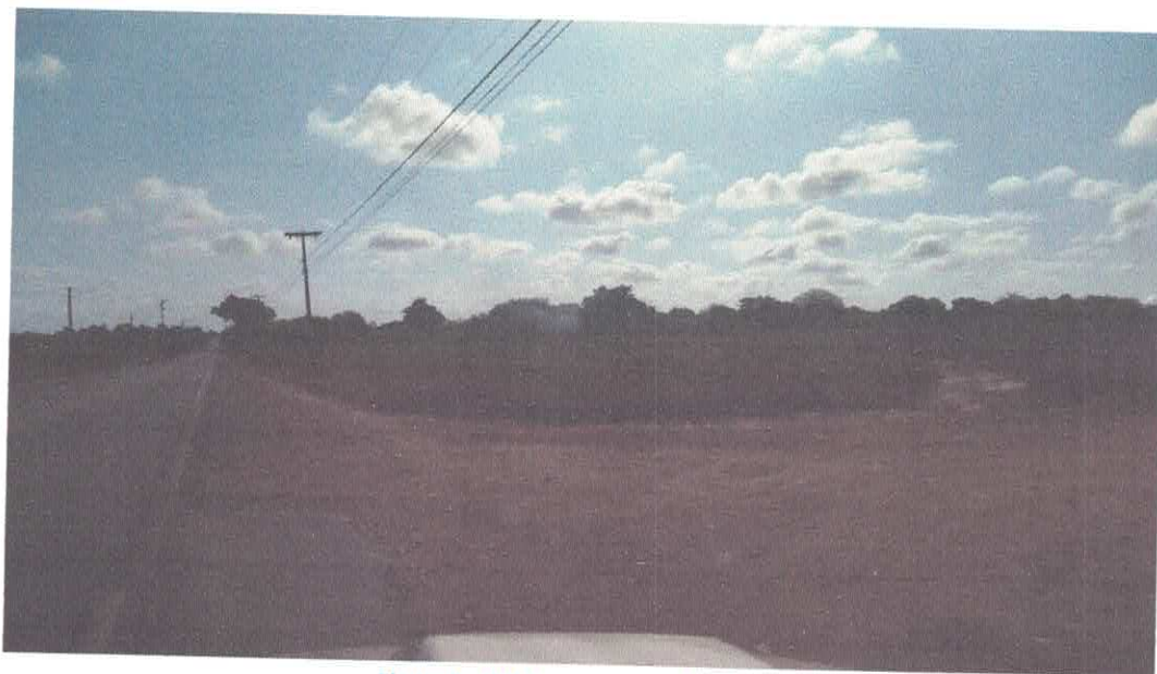
Figura 8 - DIP-2 as margens da CE 253