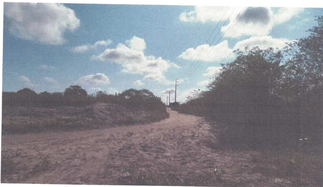
Figura 4 - Vias internas da área do DIP-2