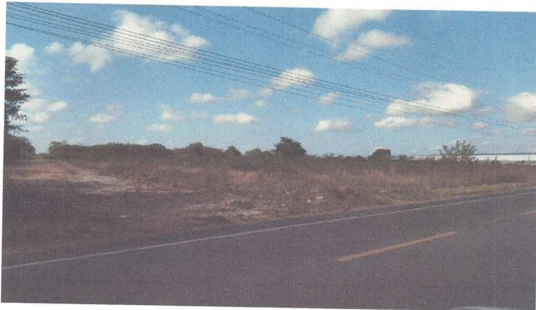
Figura 3 - Foto sentido nascente/sul