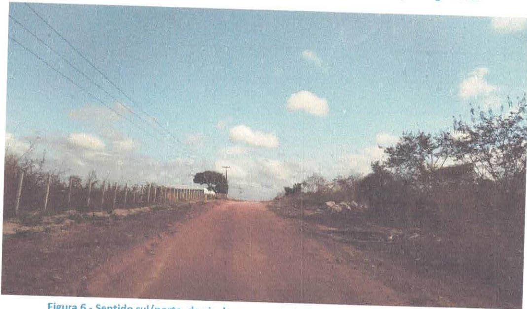
Figura 6 - Sentido sul/norte, de via de acesso principal, ao lado da empresa Igui Piscinas