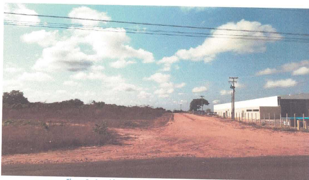
Figura 2 - Avenida principal de acesso, onde passa o gasoduto