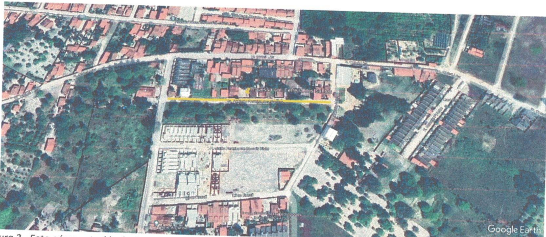
Figura 2 - Foto aérea extraída do Google Earth, mostrando localização com relação a Rua Antônio Ferreira dos Santos e Rua Chico Lira, no Bairro Buriti