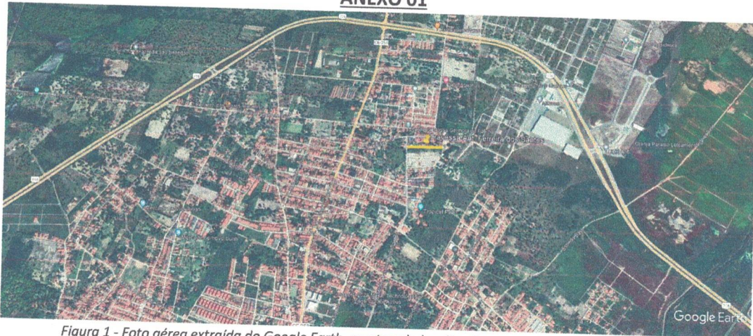
Figura 1 - Foto aérea extraída do Google Earth, mostrando localização com relação ao Centro da cidade