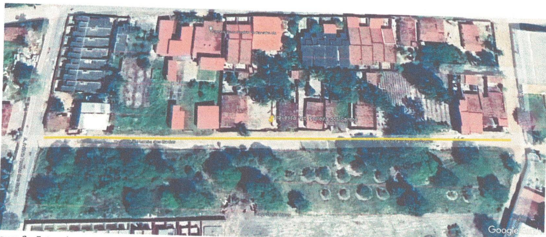
Figura 3 - Foto aérea extraída do Google Earth, mostrando localização em relação a Rua Antônio Ariston e Rua Antônio Ferreira dos Santos - 4°10'22.88"S - 38°29'6.95"O